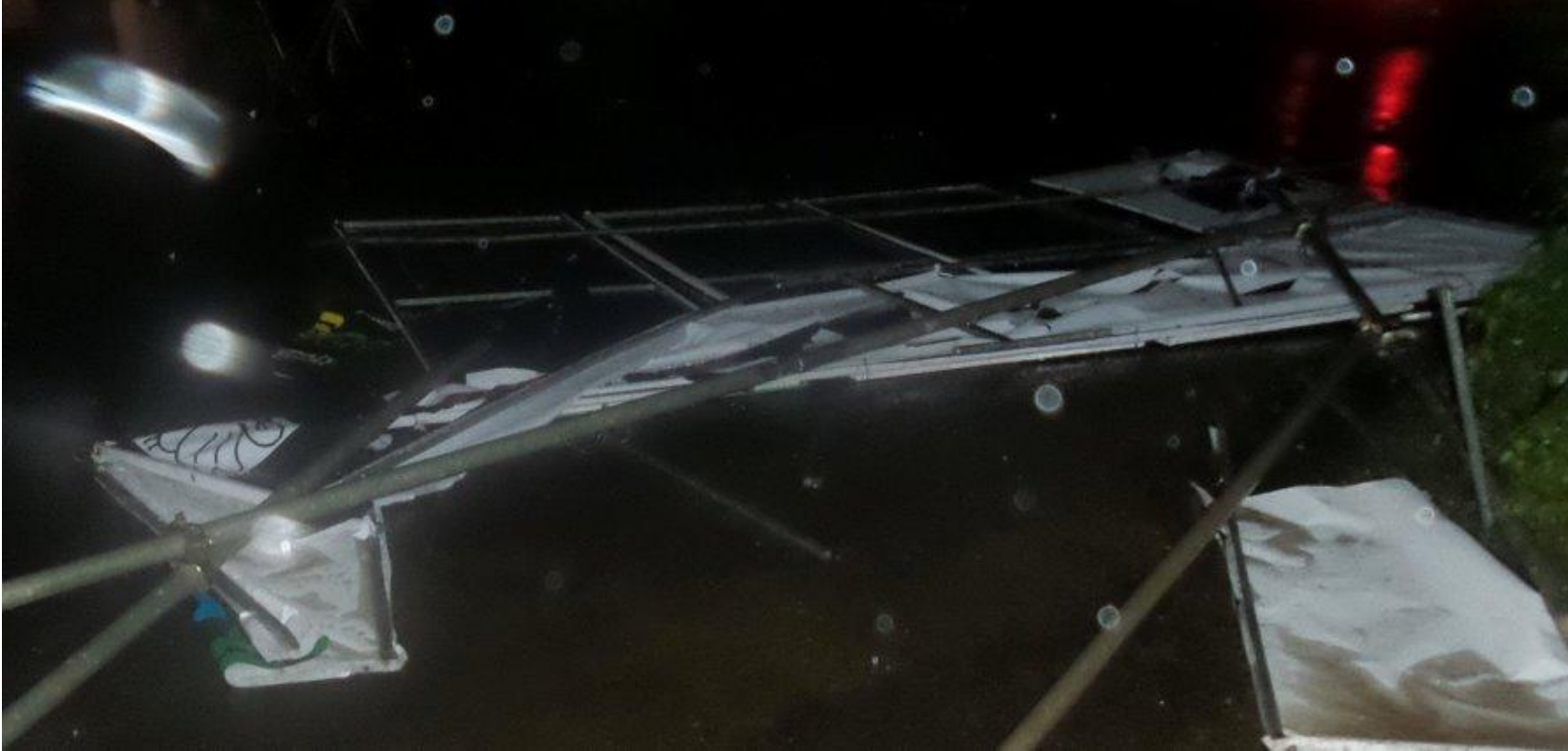
A destroyed opposition political office: The month of November marked the beginning of a series of attacks on political opposition