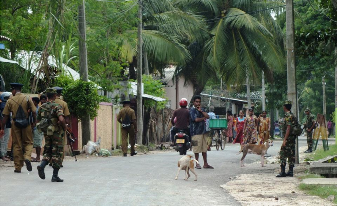
யாழ்ப்பாணத்தில் இராணுவத்தை பணிக்கமர்த்தல் அதிகரித்தது: புகைப்படம் - Tamil Net

http://tamilnet.com/art.html?catid=13&artid=37507